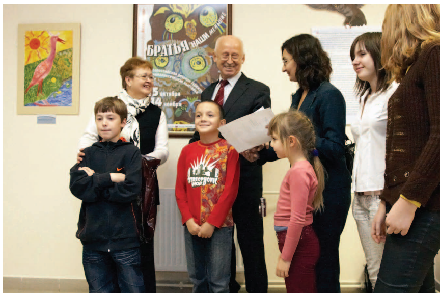
Всероссийская детская художественная анималистическая выставка «Братья наши меньшие» (5 октября — 14 ноября 2010 г.)

большой страны — от Хабаровска до Краснодарского края. Очень нежная, трогательная выставка рассказывала о бесконечно добром и доверчивом отношении детей к животному миру.