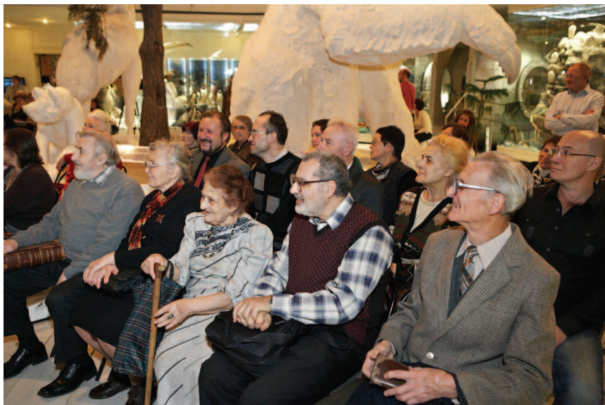
Ежегодно в Дарвиновском музее проводится День дарителя. Среди дарителей музея очень много людей пожилого возраста

очень благодатная аудитория, а с другой — крайне сложная. Пенсионеры, ограниченные, в лучшем случае, общением в ЦСО, готовы общаться с экскурсоводом часами. Экскурсии длятся по 2—3 часа, и на все предложения завершить экскурсию участники отвечают дружным отказом. Не все экскурсоводы готовы к такой работе, поэтому у нас есть несколько человек, которые готовы терпеливо проводить такие экскурсии. Они не просто проводят экскурсии, а готовы выслушать пенсионеров, поговорить с ними. Иногда время завершения экскурсии совпадает с открытием какой-нибудь очередной выставки в музее. В этом случае экскурсоводы всегда предлагают посетить вернисаж. И надо видеть счастливые глаза этих людей, которые целый день провели в музее, приняли участие в мероприятии со всеми гостями музея.