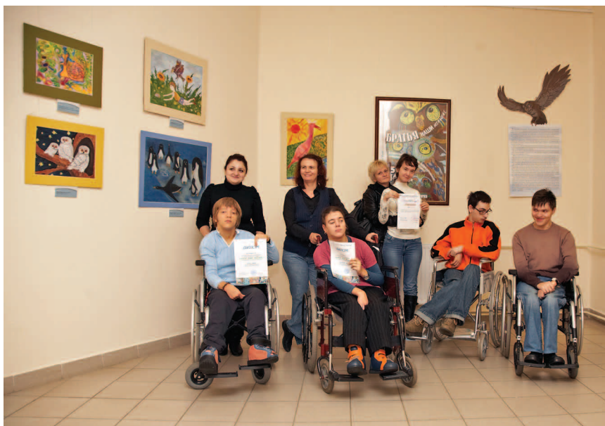
Ежегодно в Дарвиновском музее проходят выставки работ инвалидов

кулаке, так как пальцы не работают; что он глухонемой. Опять же это важно и для инвалидов, и для всех остальных. Все, кто выставлял свои работы у нас хоть один раз, становятся навсегда музеем, мы их приглашаем на все вернисажи, и они с радостью к нам приходят.