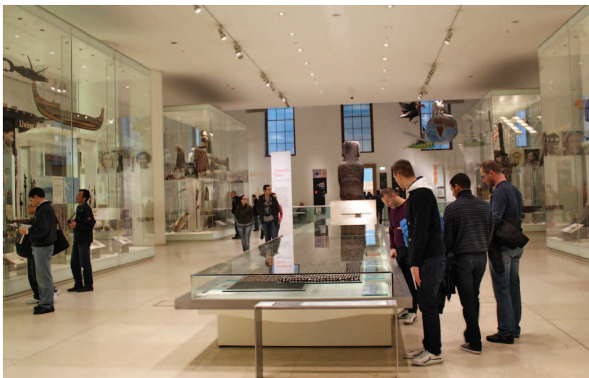
Витрины, доступные для осмотра посетителями в колясках (Британский музей)