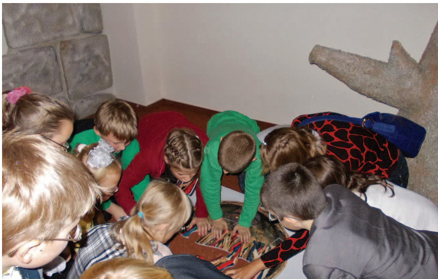
Занятие со слабовидящими детьми из интерната им. К. К. Грота

Самое главное в «Начале начал» — свобода: возможность ознакомиться с любым интересным экспонатом, оценить его поверхность, почувствовать вес, попробовать на прочность, непременно понюхать или даже лизнуть. Все можно брать в руки, читать, рассматривать, примерять и исследовать. В результате подобных сопоставлений историческое время приобретает предметно-образное измерение, а восприятие истории окрашивается личными переживаниями. «Только те знания, которые прошли через чувство ученика, — полагал известный психолог Л. С. Выготский, — могут прививаться 4 ».