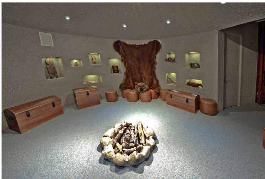
Малый зал «Начала начал»

магнитов. В данном случае существенно, что сам магнит в детском восприятии — это «волшебная» вещь, символ загадочной притягивающей или отталкивающей силы. Это мобильное «магнитное» пространство очень удобно для проведения экспресс-выставок в отделе «Начало начал».