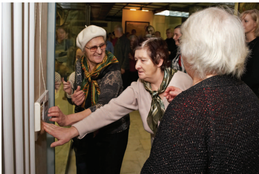
Пенсионеры — очень благодарные экскурсанты: им всё интересно и, также как дети, они хотят дотронуться до всего, что можно трогать

Известно, что во многих странах идёт процесс быстрого старения общества, вызванного низкой рождаемостью и увеличением продолжительности жизни. Коренное население Москвы также страдает этим недугом. Причём многие пенсионеры, которые ещё полны сил, энергии, активны и желают быть востребованными и приносить пользу, в силу отсутствия такой возможности вынужденно ведут замкнутый образ жизни, ограничивая себя кругом хозяйственных забот, что отрицательно сказывается на их внешнем виде, физическом и эмоциональном здоровье.