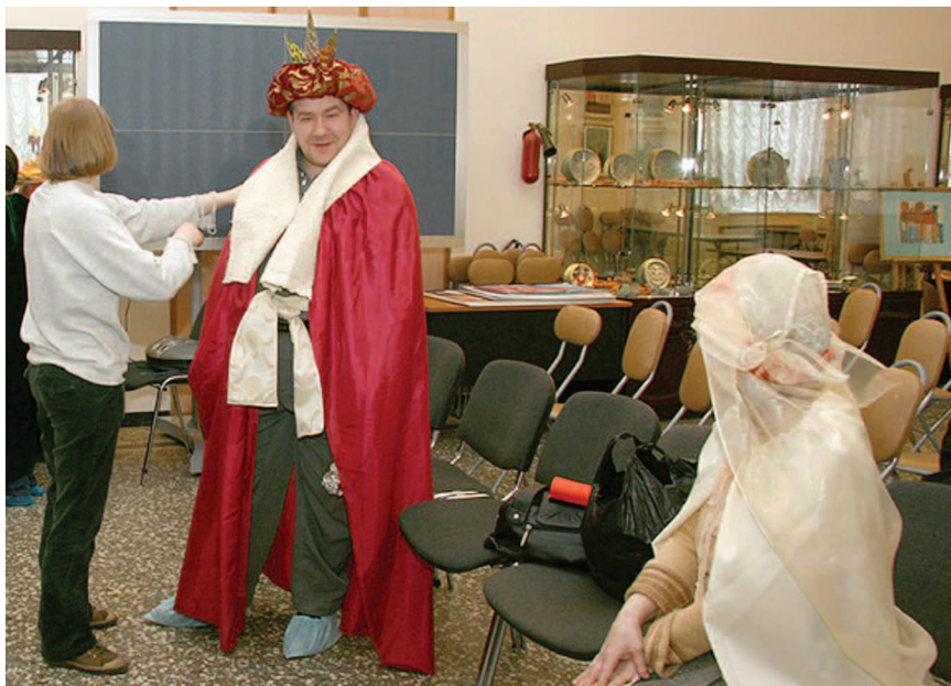
Пуримшпилеры — реабилитанты ПНД № 1 перед выступлением

привлечения внимания пациентов реабилитационных отделений ПНД к музею сотрудники НМО РЭМ пошли на организацию и проведение с ними своего рода ролевой игры в театр (говоря словами наших подопечных — «игры в настоящих артистов, звёзд, выступающих в больших нарядных залах»), в рамках которой внутреннее пространство музея предстало как её пространственно-временной континуум. Этому соответствует внутреннее убранство парадных залов музея.