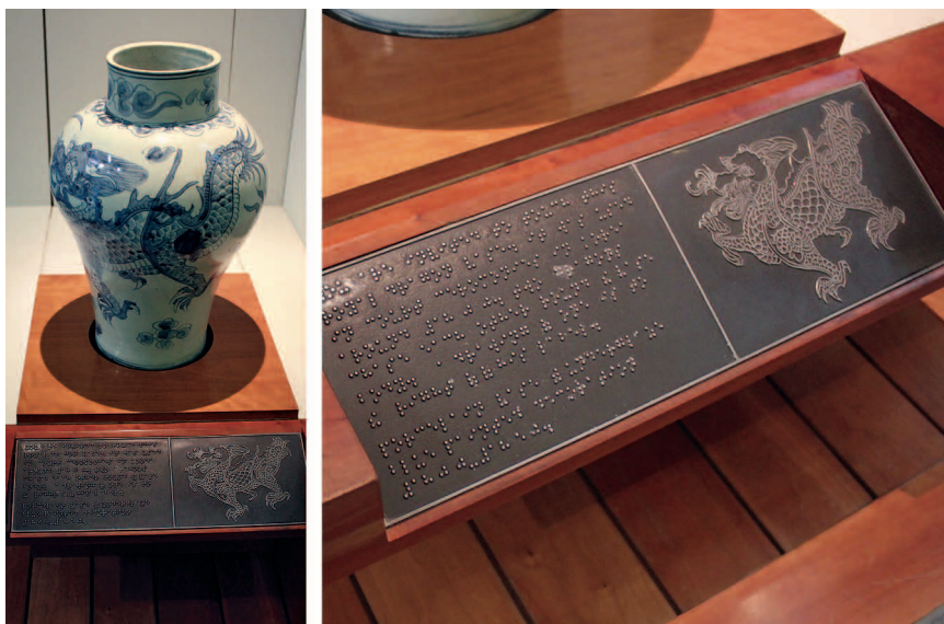
Экспонат для тактильного осмотра (Музей Виктории и Альберта)