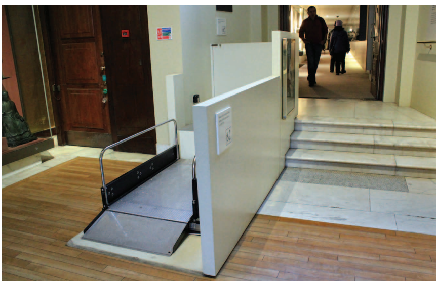
Подъемник возле лестницы (Британский музей)