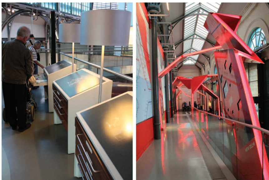
Экспозиция Музея общественного транспорта

необходимо предупреждать работников кинотеатра музея заранее при посещении его на инвалидных колясках.