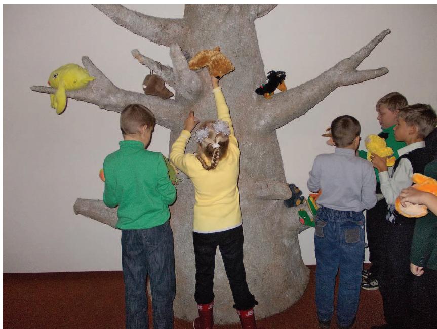
Слабовидящие дети в пространстве «Начала начал»

тие со слабовидящими детьми имеет свои особенности. Прежде всего, эти группы не должны быть большими, лучше, если количество детей не превышает 10—12 человек. Желательно, чтобы с ребятами работали одновременно два педагога. Необходимо предусмотреть время, нужное для того, чтобы каждый ребёнок подержал в руках экспонаты, «поработал» с ними. Поэтому следует также позаботиться и о кратности экспонатов. Каждому ребёнку нужно индивидуальное внимание, для него важно персональное, адресное обращение к нему лично. Это дети практически не отличаются от других, на занятиях они ведут себя заинтересованно, с удовольствием рисуют, активно собирают огромный (1,5 x 1,5 м) пазл.