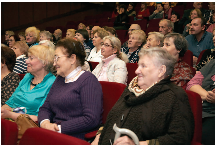
Несколько раз в год в Дарвиновском музее организуются концерты для людей старшего поколения

впечатлениями. Учреждения культуры вообще и музеев в частности в состоянии решить проблему одиночества и замкнутого образа жизни пожилых людей и привлечение их к активному образу жизни.