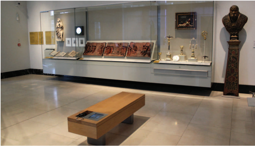
Места для отдыха в экспозиционных залах со встроенными телефонными трубками, где можно получить аудио- и видеoinформацию (Музей Виктории и Альберта)

валидов. Можно также узнать расположение специально оборудованных туалетов и места размещения кресел-колясок, которые предоставляются в самом музее.