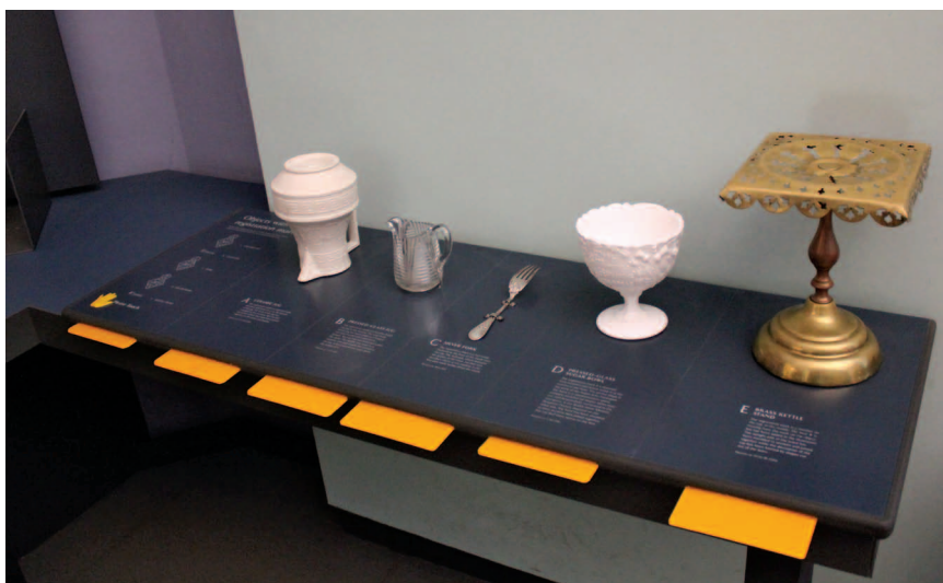
Набор экспонатов из разных материалов для тактильного осмотра. Слепые и слабовидящие могут ознакомиться с их описаниями, набранными шрифтом Брайля на выдвигающихся жёлтых пластинах (Музей Виктории и Альберта)