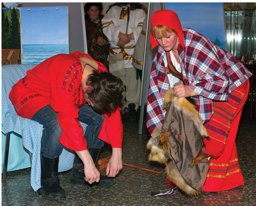
Мать Лемминкяйнена воскрешает сына. Сцена из спектакля «Калевала»

воображают себя персидским царём и его придворными, у них появляется особая пластика в движениях. В ходе репетиций специально подготовленной для показа силами инвалидов психоневрологического профиля сценической версии «Калевалы», мы попросили своих подопечных, выходя на публику, прежде чем начинать взаимодействовать с партнёрами, какими-то наиболее характерными для своего сценического героя жестами и позами продемонстрировать зрителям его характер. Это им, в целом, неплохо удалось.