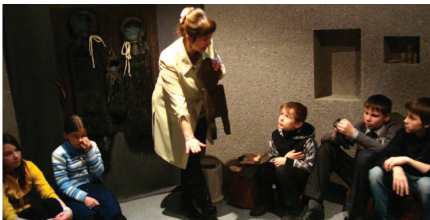
Дети из детского дома № 26

Согласно исследованиям А. И. Копытина, одного из ведущих российских арт-терапевтов, «арт-терапия обладает очевидными преимуществами перед другими — основанными исключительно на вербальной коммуникации — формами психотерапевтической работы 2 ». Наиболее значимыми из преимуществ автор считает отсутствие противопоказаний к участию в арт-терапевтическом процессе, возможность выражения с его помощью латентных идей и состояний, создание атмосферы доверия и сближения между участниками процесса, формирование положительных эмоций, мобилизации творческого потенциала 3 . Таким образом, арт-терапия использует универсальный язык искусства для гармонизации психоэмоциональных состояний «особого» человека.