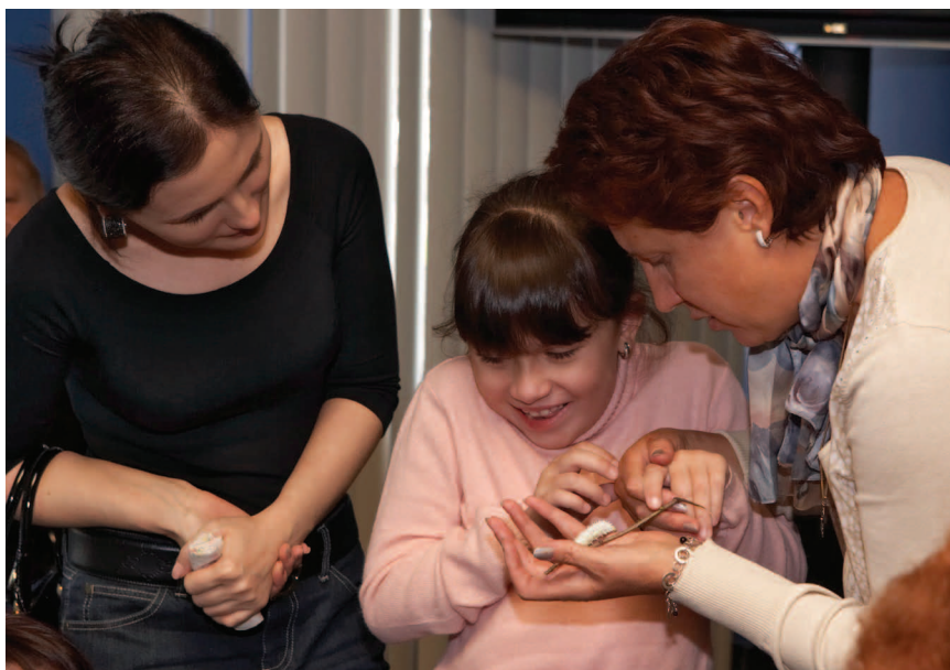
Экскурсия для слепых и слабовидящих посетителей обязательно включает посещение экзотариума, где посетители могут взять в руки живых жуков, бабочек, гусениц

ности, в Дарвиновском музее на всех долго идущих выставках есть специальные выставочные программы для посетителей. Естественно, музейные смотрители, которые их проводят, перед каждой выставкой проходят инструктаж о необходимости специальной помощи не очень здоровым детям. Совместное творчество имеет огромное значение, причём и для тех, и для других, когда все дети вместе что-то делают — и больные, и здоровые. Можно наблюдать, как здоровые дети помогают детям, у которых нарушение координация или моторика, выполнять несложные задания.