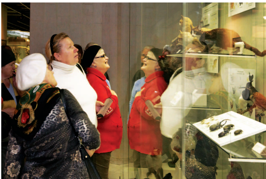
Каждый месяц в Дарвиновском музее бесплатно проводится несколько экскурсий для пенсионеров, которые организуют ЦСО города

неры вовлекаются в культурную жизнь общества, тем выше их самооценка и уверенность в себе.