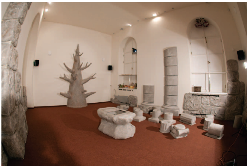
Большой зал «Начала начал»

личных элементов и составляющей художественное целое. Это является дополнительным эмоциональным стимулом для детей, повышающим их «включённость» в происходящее. Огромный масштаб мультимедиа-изображения делает программу доступной для слабовидящих детей.