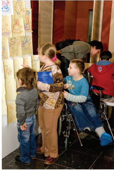
Все выставочные программы для посетителей составлены таким образом, чтобы в них могли участвовать и дети-инвалиды

Необходимо наладить систематическое обучение персонала , причём начиная с охраны: именно охранник, не дожидаясь просьбы, должен вызывать дежурного, который включит специальный лифт или сам отнесёт вещи в гардероб и принесёт номерок, чтобы инвалиду не нужно было лишний раз спускаться и подниматься. Кстати, специальные лифты для инвалидов почему-то работают очень медленно, и если в музей приезжает группа колясочников, то только посещение гардероба может растянуться на 30—40 минут.