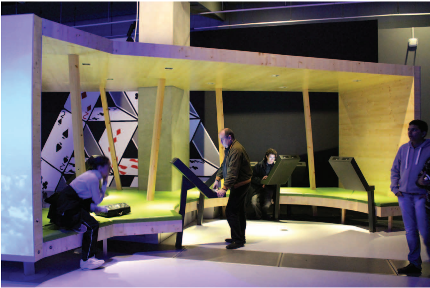
Компьютерным оборудованием на экспозициях могут воспользоваться маломобильные посетители (Музей науки)

лекций. В музее организуется целый ряд мероприятий для посетителей с нарушениями слуха и событий для посетителей с нарушениями зрения.