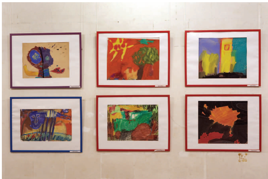
Выставка рисунков детей, страдающих аутизмом «Особые дети — особый взгляд на мир» (28 апреля — 28 июня 2009 г.)