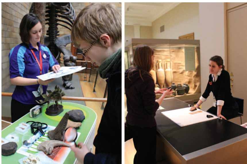
Столы «Трогать разрешается» (слева — Музей естественной истории, справа — Британский музей)

На сайте Музея Виктории и Альберта ( http://www.vam.ac.uk ) найти полезную информацию также достаточно просто в разделе Disability&Access . В отличие от Британского музея, в этом разделе предоставляется актуальная информация о реконструкции в залах, в связи с чем доступ туда инвалидам может быть затруднён.